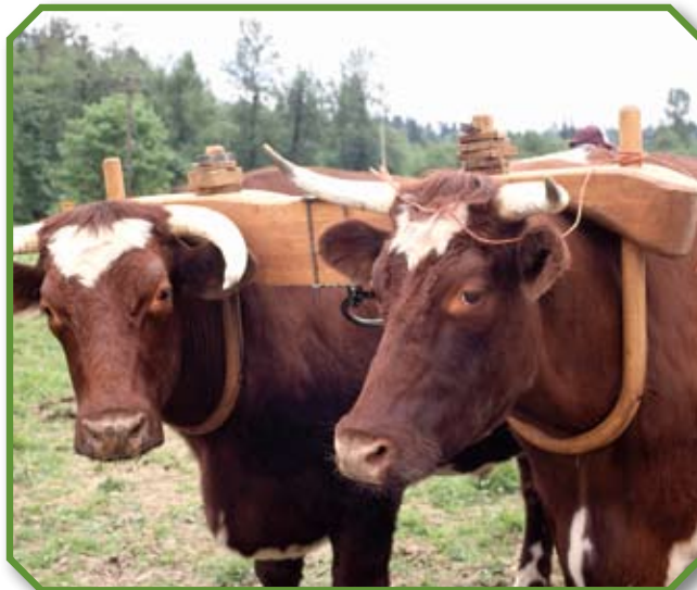
Праздник «Шавуот» в «Яд а-Шмона», 2006-й год

Апостол Павел сказал также в своем послании к Римлянам так: «Немощного в вере принимайте без споров о мнениях» (14:7) и «Посему принимайте друг друга, как и Христос принял вас в славу Божию» (Римл. 15:7). Если мы не сможем идти друг другу на уступки и компромиссы в тех вещах, которые не являются принципиальными, мы будем не в состоянии иметь здоровое общение. Подумайте о том, на какие лишения пошел Господь Иешуа для того, чтобы иметь общение с нами! Ω