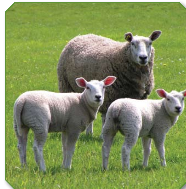
Кидуш в кайтане

«Не преклоняйтесь под чужое ярмо с неверными, ибо какое общение праведности с беззаконием? Что общего у света с тьмою? Какое согласие между Христом и Велиаром? Или какое соучастие верного с неверным? Какая совместность храма Божия с идолами? Ибо вы храм Бога живаго, как сказал Бог: вселюсь в них и