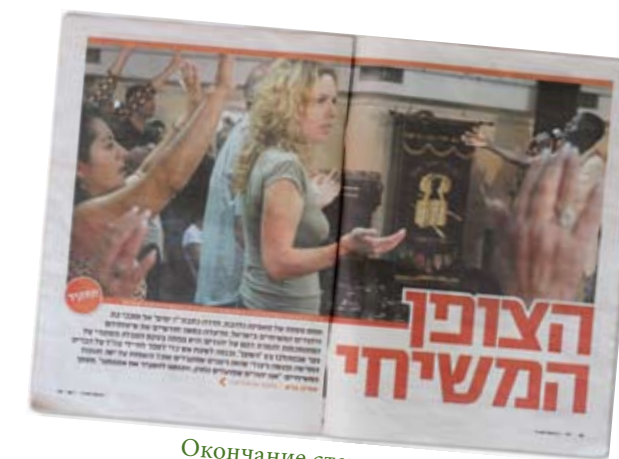
Окончание статьи со стр

В газете помещены фотографии многих верующих из общины «Тиферет Иешуа», среди них – фотографии и самой журналистки, на одной из которых она запечатлена участвующей в собрании общины, а на другой – раздающей брошюры на улице одного из городов Израиля. Закончив сбор материалов, которые