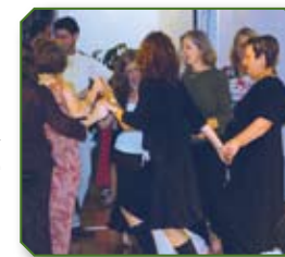
Танцы в общине

Во-вторых, как народ священников, мы призваны к молитве и ходатайству. Мы все призваны нести имена сынов Израилевых на своих плечах и сердцах, и приходить перед Ним с ходатайством, молитвой и мольбой за наш народ и за другие общины в Теле