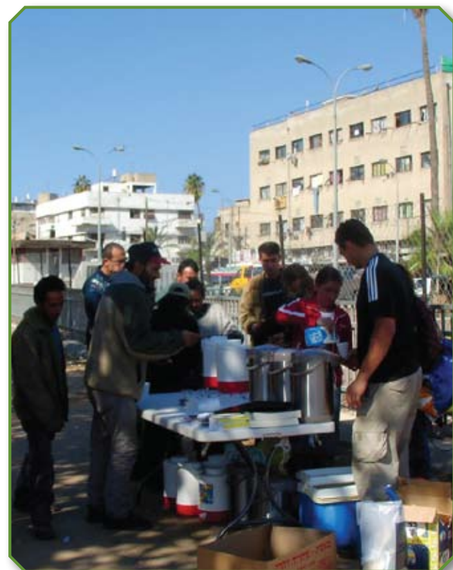
Евангелизация в Тель-Авиве

Каждый раз он пользовался одним и тем же методом: