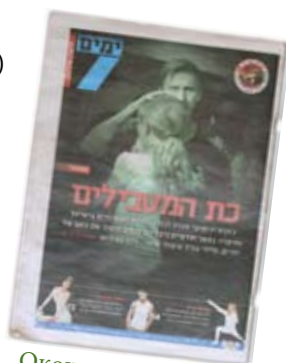
Окончание статьи со стр

блондинки, одетой в белое (...) прибегая к использованию манипулятивного языка и образов, статья берет обычные миссионерские мероприятия мессианских евреев и представляет их так, чтобы они потрясли читателя или возмутили его (...) использование эмоционально заряженного термина «секта» - это попытка заклеить мессианских евреев, служащая их демонизации.» Ω