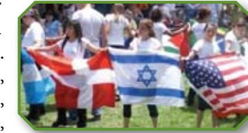
Конференция во время праздника «Шавуот» 2008 года

После того, как Апостолы Петр и Иоанн исцеляют хромого именем Мессии Иешуа, священники и саддукеи арестовывают их и сажают в тюрьму (стихи 1-2). (В современном Израиле такое пока еще не происходит, но именно этого добивается религиозный истеблишмент: провести законы против благовестования об имени Иешуа, чтобы стало возможно «законным» образом