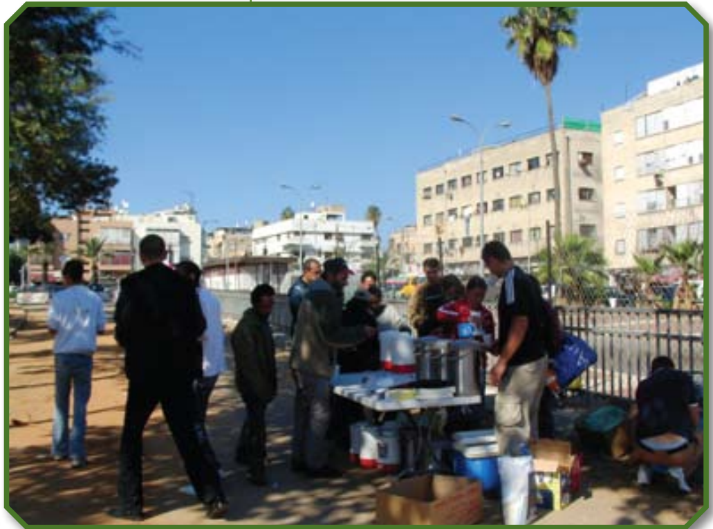
בישור בתל אביב