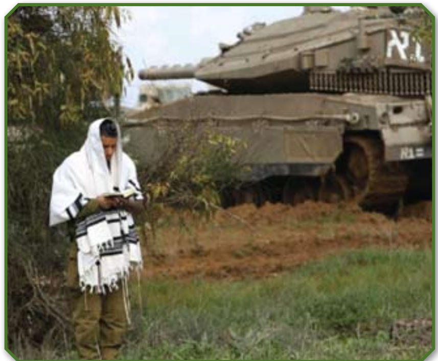
חייל על גבול רצועת עזה

תפילתנו היא שבעזרת אבינו שבשמים ואדונינו ישוע המשיח נוכל להבין את האירועים הצבאיים והמדיניים המתרחשים סביבנו בימים מיוחדים אלה של