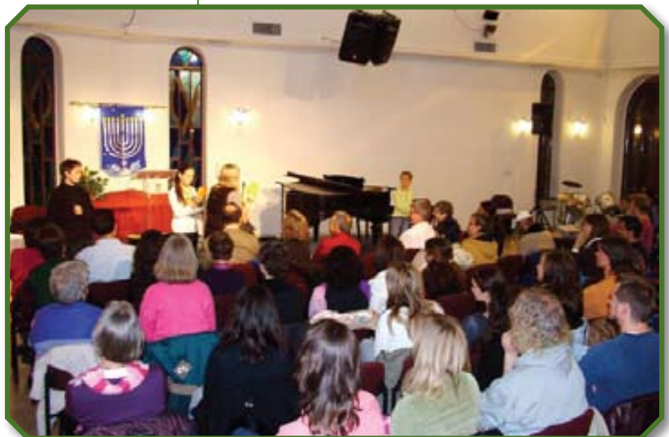
קהילת אל רואי

קהילת האלוהים מיועדת להיות עם של כוהנים. כיפא השליח כינה את קהילת האלוהים "אבנים חיות"