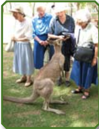
טיול לגן גורו