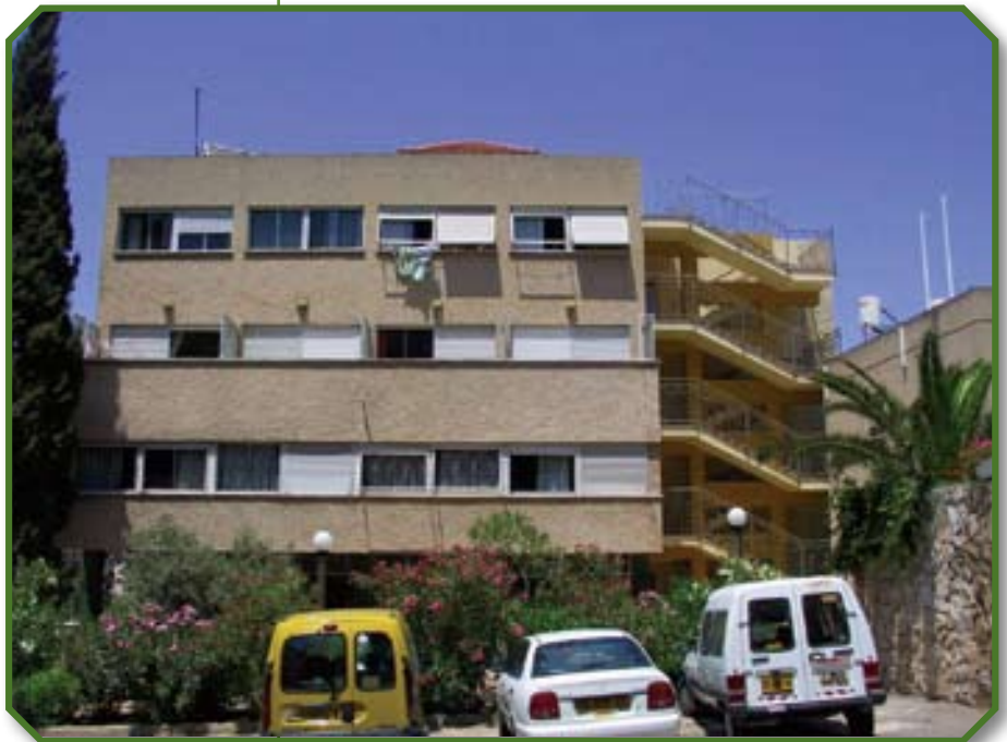
בית אבות ”אבן העזר”

להקמת בית האבות בפברואר 1976 קדמו שנים רבות של תפילה ועבודת הכנה של ה-NCMI יחד עם ארגונים נוספים, בעיקר מסקנדינביה וגרמניה - כולל ה-UCCI (United Christian Council in Israel). עזרה הגיעה גם מקהילות ואנשים פרטיים