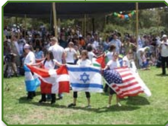
כנס שבועות 2008

ברוח הקודש כנגד שרי העם וזקניו באומרם (פס' 10-12): שיהא ידוע לכולכם ולכל עם ישראל כי בשם ישוע המשיח אשר אתם - על פי עצת אלוהים הנחרצה וידיעתו מראש - צלבתם ואשר אלוהים הקימו מן המתים, בשם הזה האיש הפיסח עומד בריא לפניכם. הוא, ישוע המשיח, הוא "האבן שמאסו הבונים, אשר הייתה לראש פינה". ואין רפואה באחר, כי אין שם אחר נתון לבני אדם תחת השמים, ובו עלינו להיושע.